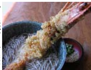
デッカイおいらを食べとくれ!

当然ですが、美味しいのは宴会料理だけではありません。この店に来たら一度は挑戦したいのが、この大海老そば(二千円)でしょう。