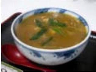
トロリとしたカレー出汁がファンを掴むのです。

私は一年三六五日カレーを食べてもいいと自負する大カレーファンですが、そんな私のオススメが、「生そば 川しま」(九品寺)のカレーそば(600円)です。