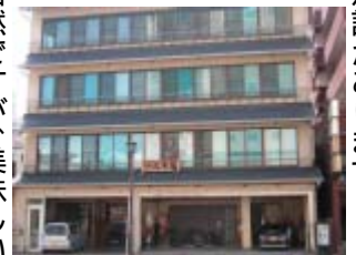
山本屋は、熊電藤崎駅駅前2階は大宴会場です。

当然ですが、美味しいのは宴会料理だけではありません。この店に来たら一度は挑戦したいのが、この大海老そば(二千円)でしょう。