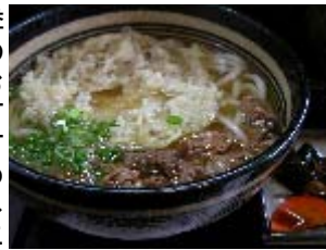
美味しい天ぶらにつられて来る客も多い。

出汁のしみ込んだゴボウ天を麺と一緒に口に入れると、これだけで幸せな気持ちになりますね。